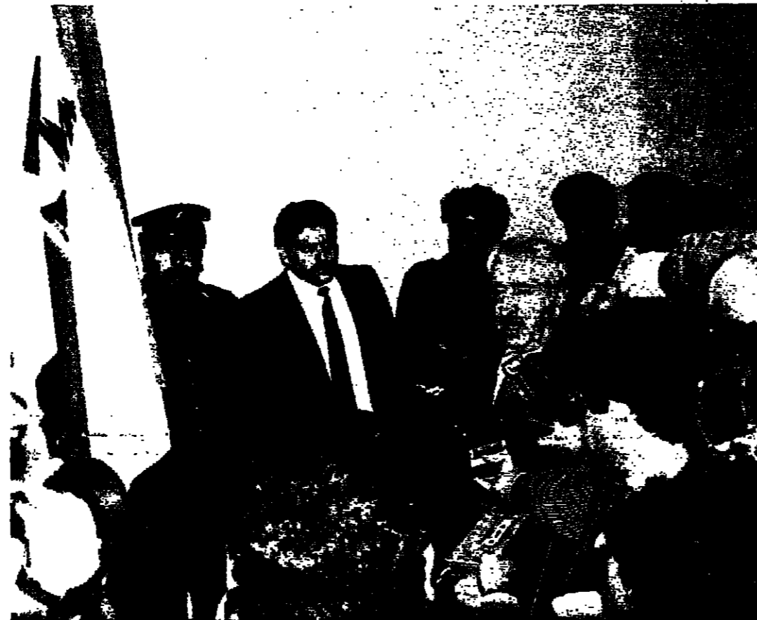
رئيس الحكومة يخاطب